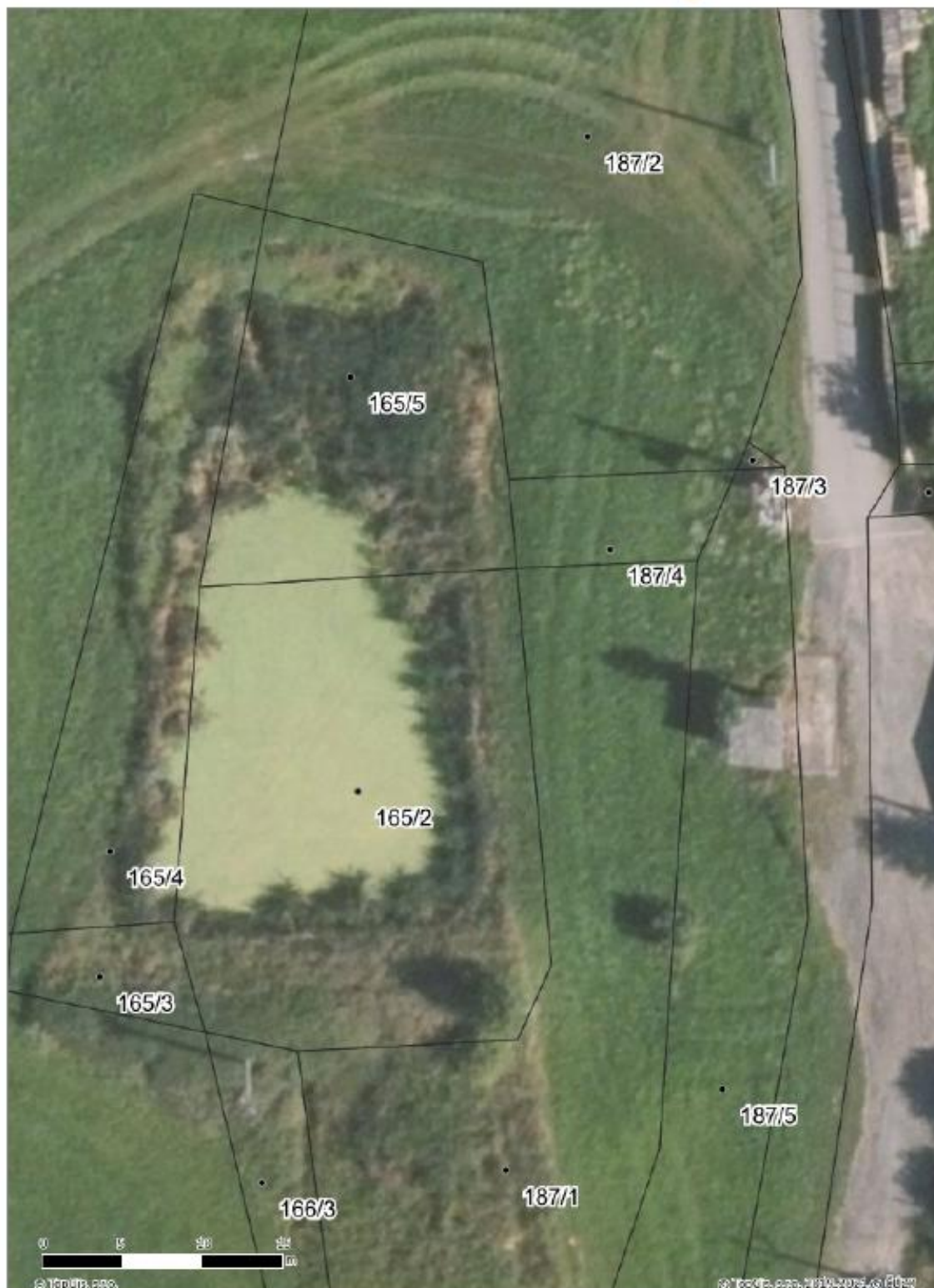
Požární nádrž "Obecní rybník" č.parc. 165/2