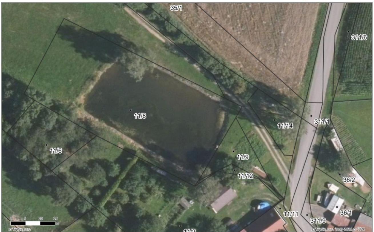
Požární nádrž "Čihákův rybník" č. parc. 11/8