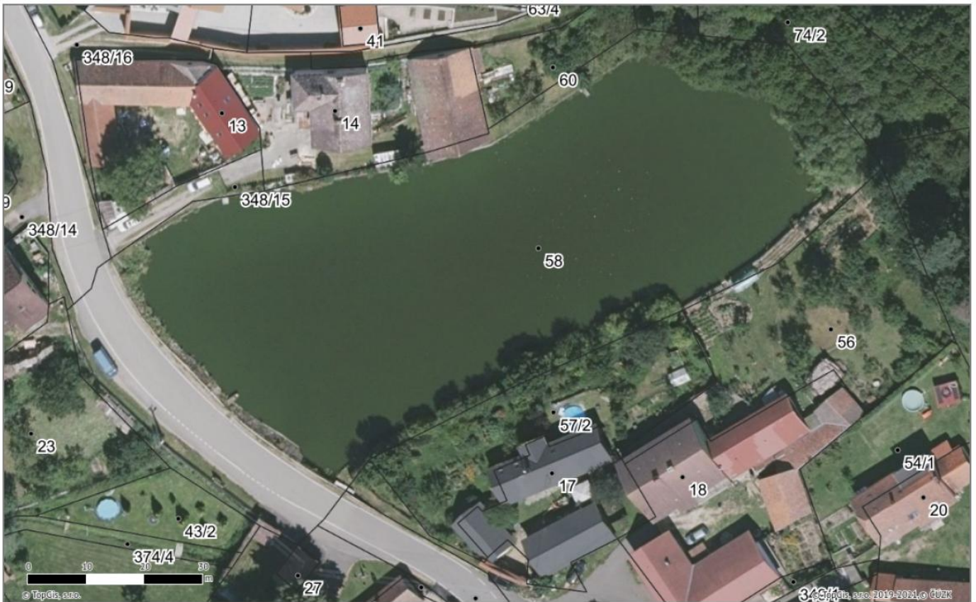
Požární nádrž - "Klisinčák" č.parc. 58